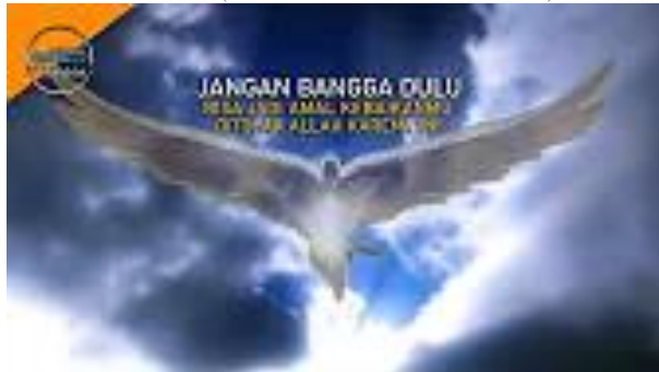
4 WASIAT ROSULULLOOH SAW ( Hadits dari Abu Dzar Al Ghiffari r.a )